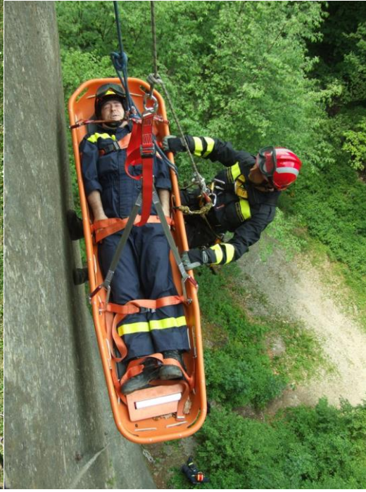
Spašavanje sa visina