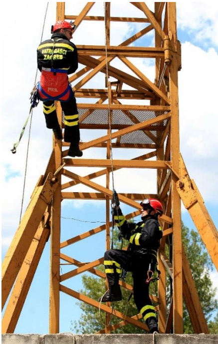
Vježba na kranu